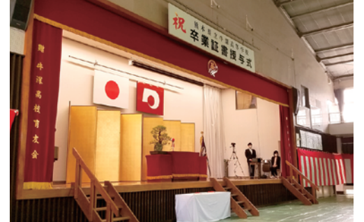
少人数でも感動の卒業式でした。