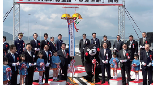
長年の夢が叶う。「天草未来大橋」