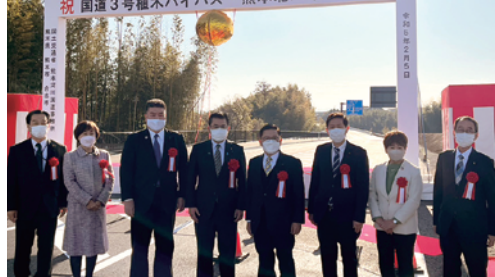
植木・花園方面の時間短縮に期待。