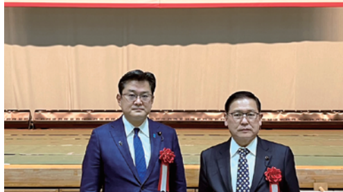
渋滞解消に期待大。早期完成願う。