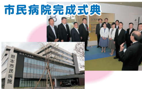
市民病院完成式典 9月21日、被災した熊本市市民病院の完成式典に参加、新設された、こども外来について説明を受けました。