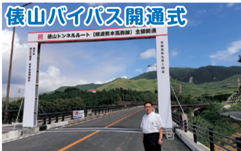
俵山パイパス開通式 9月14日、熊本地震で大きな被害を受けた西原村、南阿蘇につながる俵山パイパスがやっと開通しました。