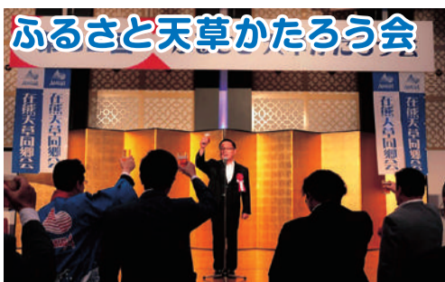
ふるさと天草かたろう会 7月22日、毎年、大勢の参加者で賑わう「天草かたろう会」。友人と会い、故郷を語るひとは最高です。