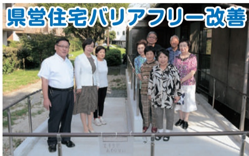
県営住宅バリアフリー改善 8月19日、高齢者の多い県営保田窪第2団地、トイレの洋式化や段差解消の要望があり、この度完成しました。