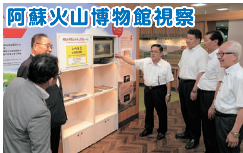
阿蘇火山博物館視察 8月20日、熊本地震で建物や道路に被害を受けましたが、見事に再開した博物館の現状を視察しました。