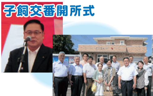
子飼交番開所式 8月19日、老朽化や狭隘で建て替えが望まれていた旧薬園町交番、地元の要望を受け、新交番が開所しました。