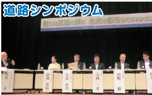
道路シンポジウム 8月28日、熊本市主催の「新たな道路で描く 未来の都市づくりシンポジウム」が開催され参加しました。