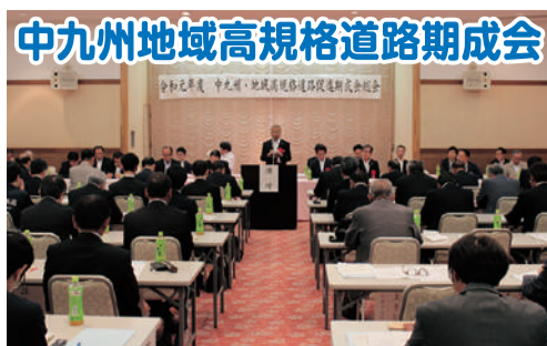
中九州地域高規格道路期成会 7月26日、熊本の生活・経済・防災に欠かせない道路整備、中九州高規格道路の早期完成が急務です。