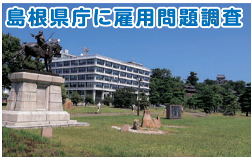
島根県庁に雇用問題調査 8月2日、地元雇用確保に力を入れている島根県に、県内の雇用情勢や最低賃金の状況を伺ってきました。