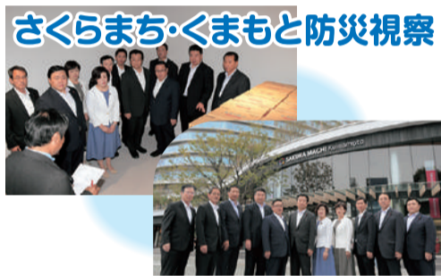
さくらまち・くまもと防災視察 9月21日、同月14日にオープンした、同施設を訪問し防災対応や防災備蓄品の管理状況を視察しました。