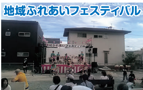
地域ふれあいフェスティバル 7月24日、毎年この時期に黒髪校区内にある福祉施設、リデルライトさん主催の夏祭りに参加しています。